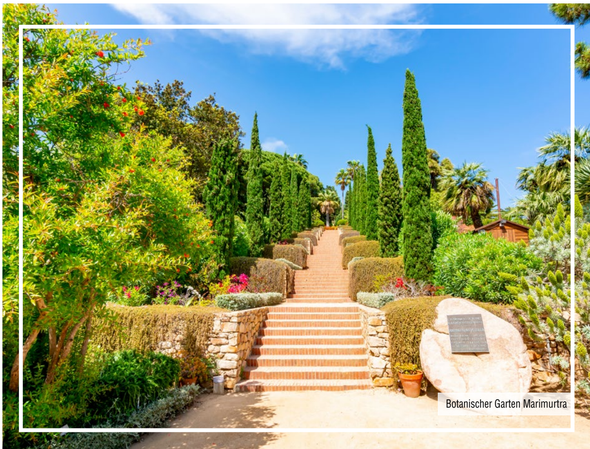
Botanischer Garten Marimurtra

Botanischer Garten von Marimurtra | Gotischer Brunnen | Fischereihafen