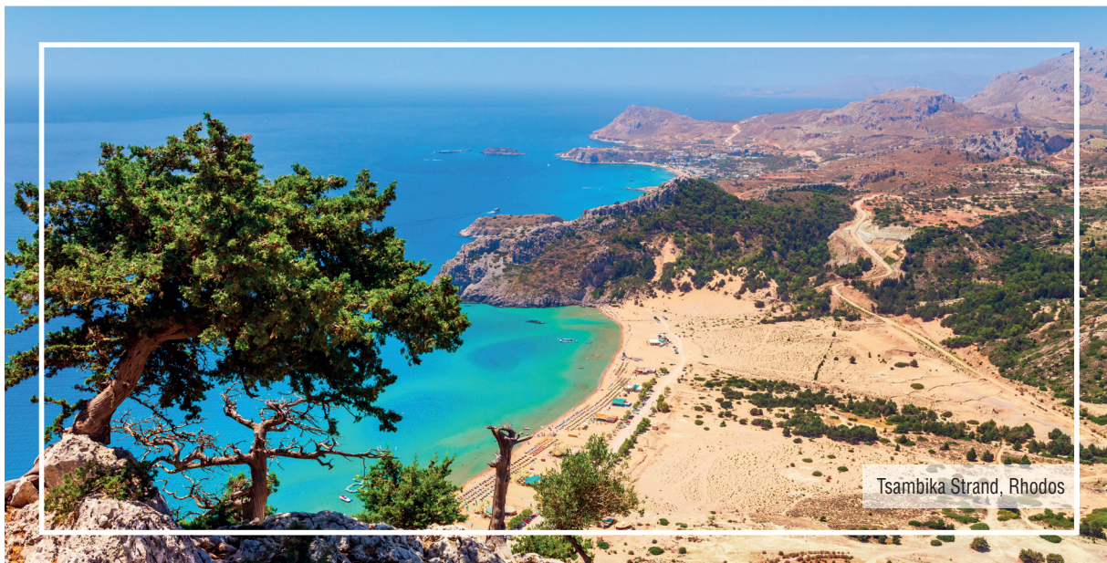
Tsambika Strand, Rhodos

Das mediterrane Klima der Insel zeichnet sich durch milde Winter und heiße Sommer aus. Mit 3.000 Sonnenstunden im Jahr zählt die Insel zu den sonnigsten Regionen in Europa . Von Mai bis September ist kaum Regen zu erwarten. Die Durchschnittstemperatur im Sommer liegt bei etwa 40 °C . Durch den Seewind und die niedrige Luftfeuchtigkeit wird sie fühlbar gesenkt.