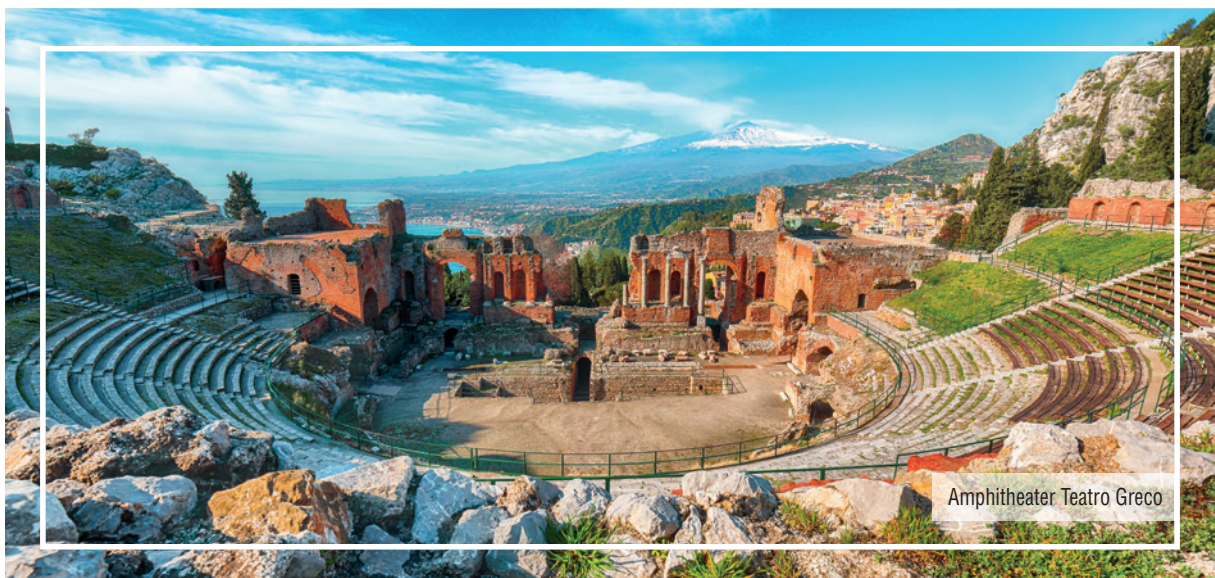
Amphitheater Teatro Greco