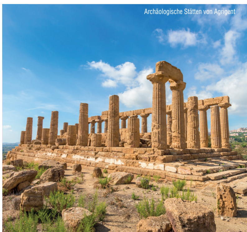
Archäologische Stätten von Agrigent